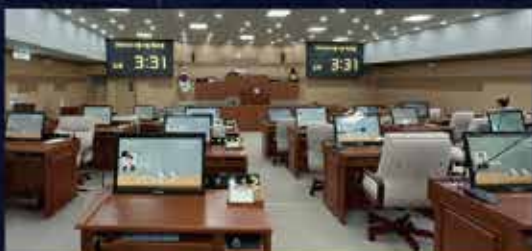
▲ 아산시의회 전자회의 전자투표 구축사례