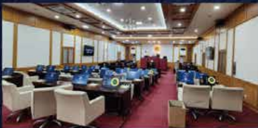
▲ 대구광역시의회 전자회의 전자투표 구축사례